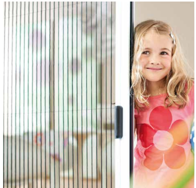
Das MHZ Insektenschutz Plissee ist besonders platzsparend, kinderleicht zu bedienen und sehr sicher.