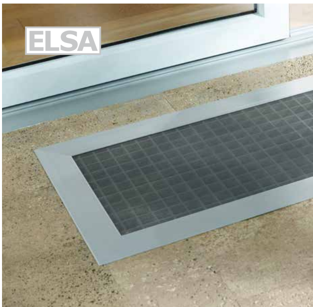
ELSA wird als Komplett-Element in den Lichtschacht montiert.

Maßgeschneidert – die eleganten Aluminiumprofile in dunkelgrau pulverbeschichtet mit Glimmereffekt und das hochlegierte Edelstahlgewebe erhalten Sie passgenau für jeden Lichtschacht.