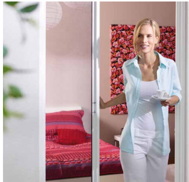
Das MHZ Insektenschutz Quer-Rollo für Türen wird häufig dort angebracht, wo wenig Platz zur Verfügung steht.