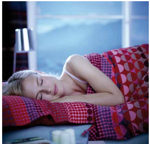
Die einzelnen Maschenöffnungen sind bei Transpatec® kleiner als bei herkömmlichen Standardgewebe. Die Durchsicht und der Schutz vor Insekten ist dadurch noch besser.