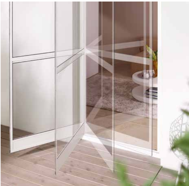
Die Pendeltür eröffnet einen überaus bequemen Durchgang.