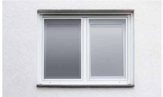
Die Außenansicht im Vergleich: Standardgewebe (links) und Transpatec®-Gewebe (rechts).