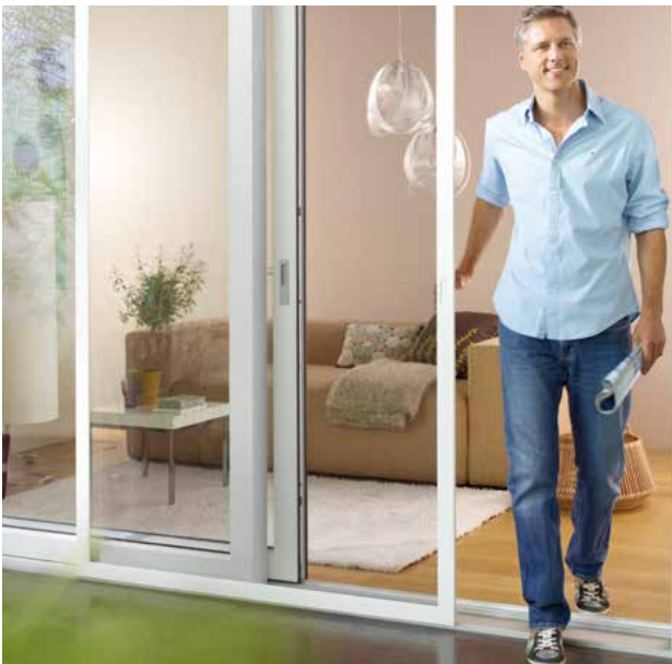
Die MHZ Insektenschutz Schiebeanlage ist eine clevere Verbindung von Komfort und Design.