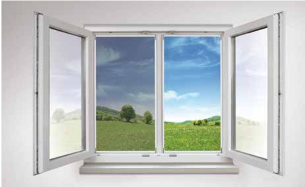
Die Dursicht von Innen im Vergleich: Standardgewebe (links) und Transpatec®-Gewebe (rechts).