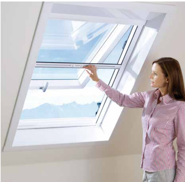
Das MHZ Insektenschutzrollo ist die beste Lösung für Dachflächenfenster: innen angebracht lässt es sich einfach und sicher bedienen.