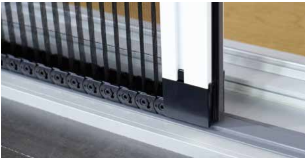
Die Kettenglieder verschwinden bei Nichtgebrauch optisch ansprechend im Aluminium-Rahmenprofil.

Auch an großen Hebe- und Schiebetüren lässt sich ein MHZ Insektenschutz Plissee ideal anbringen. Und trotz der Größe bleibt es kinderleicht und mit geringer Kraft bedienbar. Durch die integrierten Spannschnüre verkippt es nicht und bleibt in jeder gewünschten Stellung stehen.