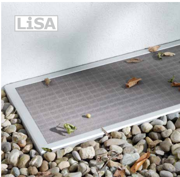
Alle Lichtschachtabdeckungen sind problemlos begehbar.