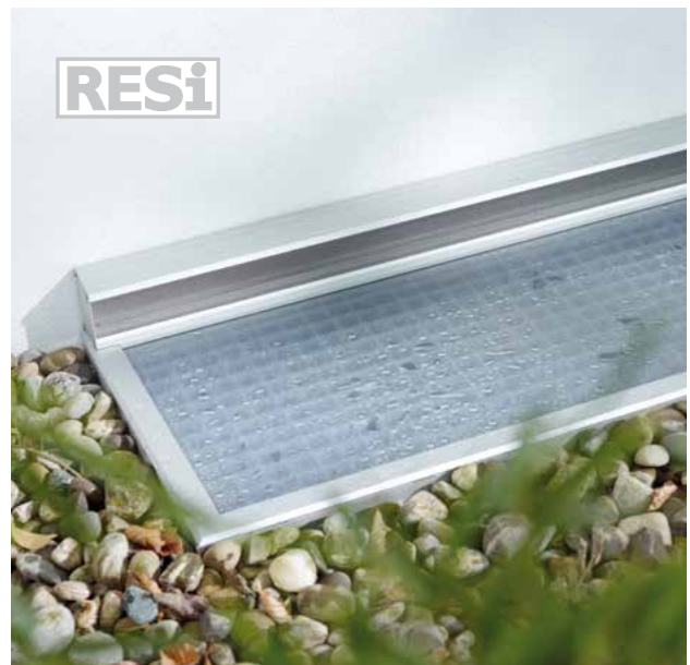
Die regensichere Variante RESi verfügt über einen insektendichten Lüftungskasten.