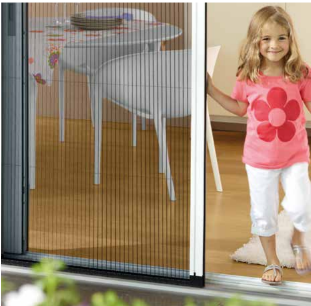
Auch an großen Hebetüren lässt sich ein MHZ Insektenschutz Plissee ideal anbringen.