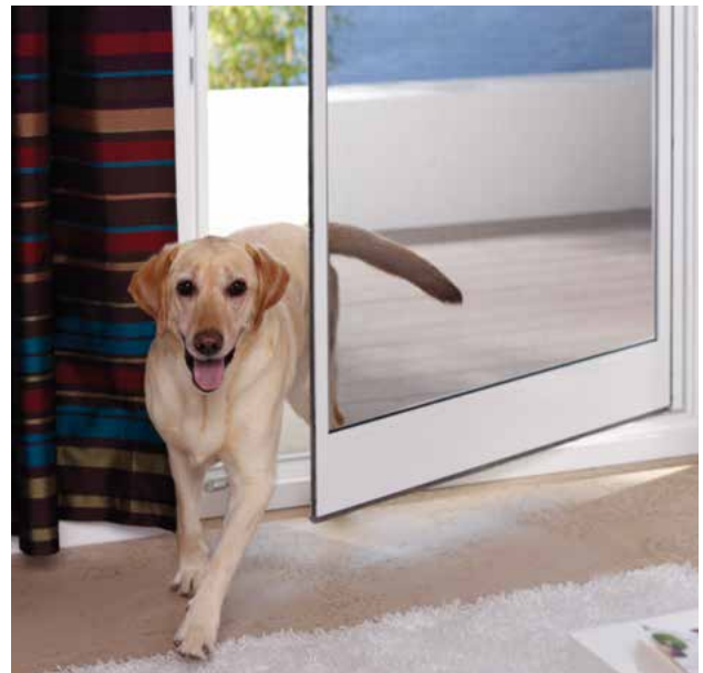
Mit Einsatz von kratzfestem Gewebe können auch Hunde die Pendeltür selbstständig bedienen.

Bestens alltagstauglich: wir fertigen Ihren Drehrahmen auch als Pendeltür. Selbst wenn Sie gerade keine Hand frei haben – Ihr Drehrahmen pendelt in beide Richtungen auf. Und schließt dann ohne jedes Zutun hinter Ihnen, sanft, geräuschlos und wie von selbst.