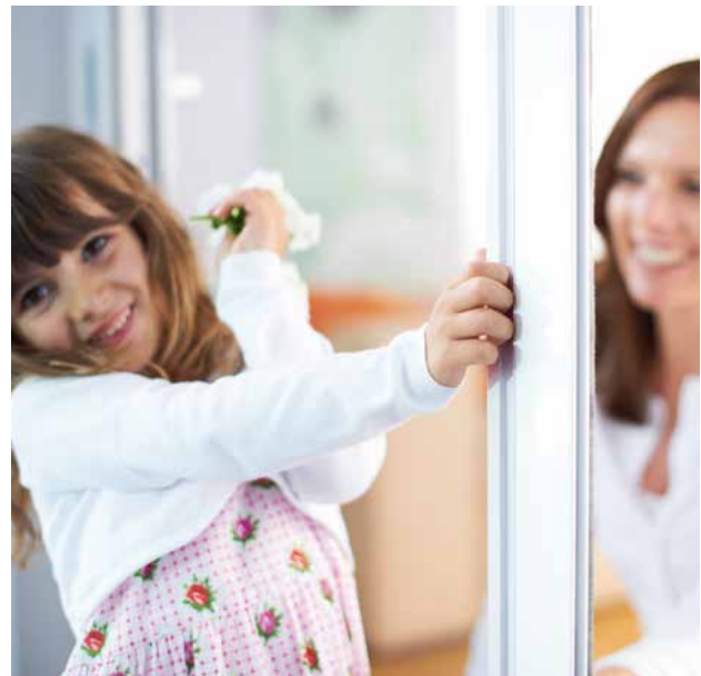
Bequeme Bedienung über die gesamte Höhe durch die Griffleiste.