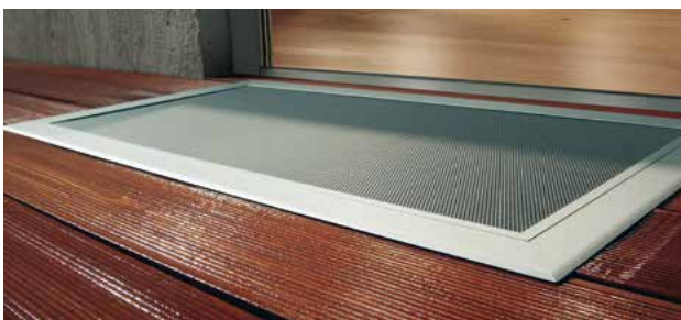
Die elegante TERRESA wurde speziell für den Einsatz auf Holzterrassen entwickelt.