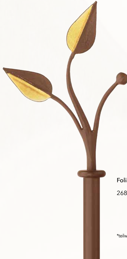
Folia* 268 rost