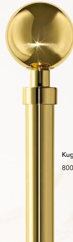
Kugel 800 Messing

*Endstück kombiniert mit CRYSTALLIZED™ - Swarovski Elements