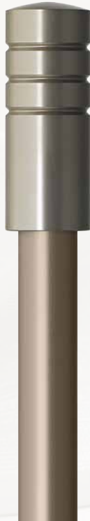
Zylinder 250 nickelfarbig matt