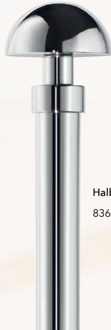
Halbkugel 836 Chrom