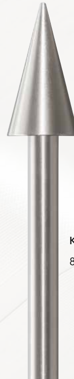
Kegel 802 V2A Stahl