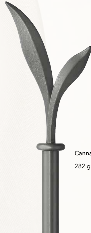
Canna 282 grafit