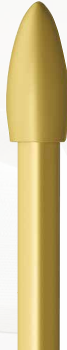
Tropfen 234 messingfarbig matt