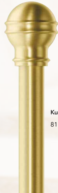
Kugel Antik 811 Messing matt