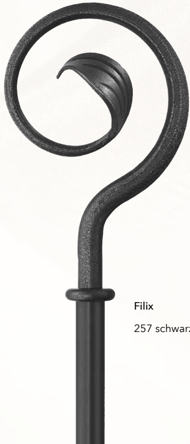
Filix 257 schwarz