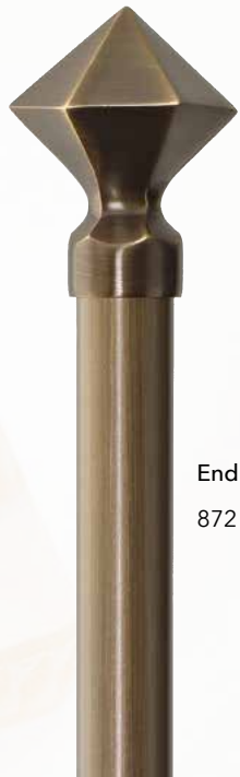
Endknopf 872 Messing bronziert